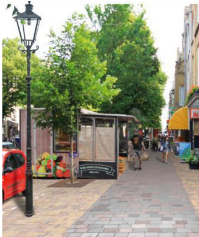
Impressie inrichting Frederik Hendriklaan.